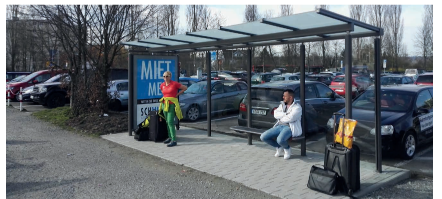
Das Warten bei Schlechtwetter – insbesondere, wenn der Fernbus sich verspätet – ist auf dem Döbele nun angenehmer. Die Stadt hat hier einen Unterstand errichtet. Dieser kann auch mit an den neuen Standort am Mobilpunkt Brückenkopf Nord verlegt werden. Bis zum Umzug der Fernbushaltestelle kann es aber noch gut zwei Jahre dauern. Die Pflasterarbeiten auf dem Döbele wurden von der Stadt ausgeführt, der Witterungsschutz wurde von der Firma Schwarz gestellt.

Neuer Witterungsschutz an der Fernbushaltestelle Döbele