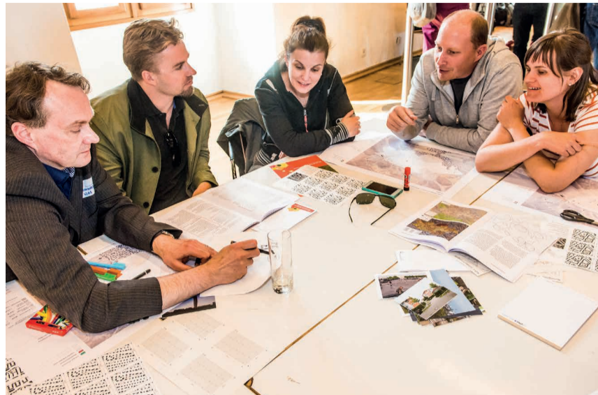
Bürger im Austausch mit den Planern am Arbeitstisch

Dichte und Landschaft im Fokus des 1. Bürgerforums Hafner