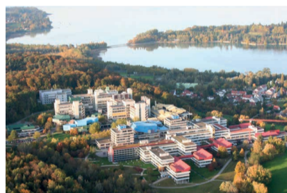
Luftbild der Universität Konstanz

Die öffentliche Preisverleihung mit OB Uli Burchardt und Uni-Rektor Ulrich Rüdiger findet am 18. April, um 18 Uhr im Stadtarchiv Konstanz am Benediktinerplatz 5a statt.