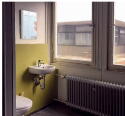
Sanitärraum mit Dusche und WC

Interessierte sind eingeladen, am 03.05.2018 um 17 Uhr die Einrichtung und das dazugehörige Betreuungskonzept kennenzulernen. Mit dabei ist auch Ludwig Egenhofer vom Landratsamt, dessen Amt die soziale Betreuung der BewohnerInnen sicherstellt. Weitere Informationen zur Entwicklung des rund 70.000m 2 großen Bückle-Areals auf der Website von i+R.