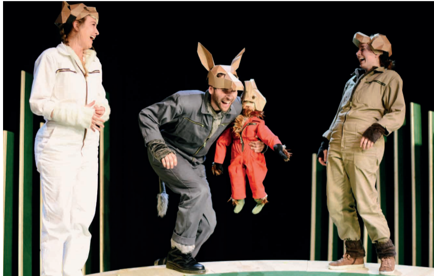
Szene aus „Der Hahn ist tot“

Karten: Theaterkasse, Konzilstr.11, Konstanz, Tel. +49 (0) 7531 900150, theaterkasse@konstanz.de