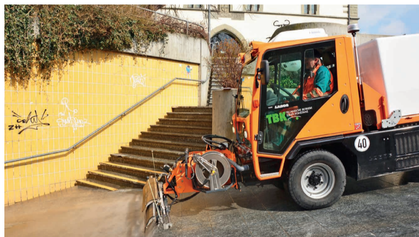
Reinigungsarbeiten in der Unterführung der Marktstätte

um den Grillplatz zu säubern. Das heißt die vielen Glasscherben, Flaschen und Kronkorken zu entfernen, die sich dort angesammelt haben, die Abflussschächte zu reinigen, die Sträucher zurückzuschneiden und die Grillstellen wieder benutzbar zu machen. Und auch an der Marktstätte gibt es viel zu reinigen. Mit speziellen Geräten wird der Boden der Unterführung geschrubbt - so kann auch Kaugummi auf dem Stein entfernt werden. Schließlich geht es darum, ein schönes Stadtbild für die Konstanzerinnen und Konstanzer, aber auch für die Gäste, zu präsentieren, damit sich alle wohlfühlen können.