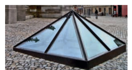
Glaspyramide auf dem Münsterplatz

Seit dem 1. Jahrhundert nach Christus bestand auf dem Münsterhügel eine römische Siedlung. Mit Zunahme der germanischen Bedrohung wurde um 300 n.Chr. ein mächtiges Kastell errichtet. Teile dieser Anlage sind seit 2005 freigelegt und auch dank einer Förderung durch die Landesstiftung Baden-Württemberg zugänglich gemacht worden. Carola Berszin wird dem interessierten Publikum die Funde am Freitag, den 20. und 27. April, jeweils um 18 Uhr erläutern. Der pauschale Eintritt von einem Euro wird direkt vor Ort erhoben.