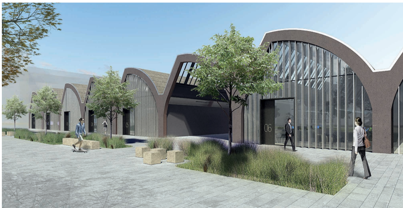
Die Shedhalle als Mittelpunkt des neuen Quartiers auf dem ehemaligen Siemens-Areal.

Als zentraler Treffpunkt soll das Innovationsareal in das neu entstehende Quartier zwischen Bücklestraße und Bahnlinie eingebunden werden. Insbesondere die Shedhalle soll mit einem Mix aus Gastronomie-, Kulturangeboten und Läden für ein attraktives Umfeld sorgen.