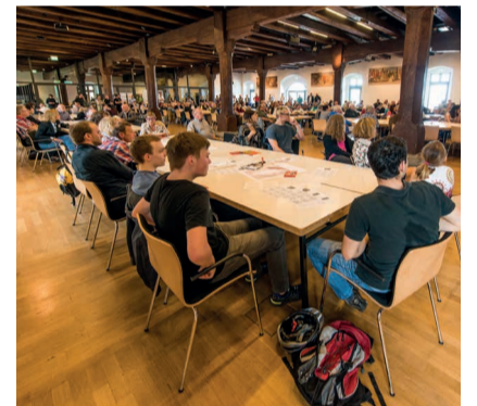
Teilnehmer des Bürgerforums

Nun haben die Wettbewerbsteilnehmer drei Monate Zeit, ihren detaillierten Entwurf zu erarbeiten, in den auch der Input aus dem Bürgerforum einfließen kann. Die eigearbeiteten Arbeiten sind im Juli in einer Ausstellung zu sehen. Eine interdisziplinäre Jury, die sich auf den Bürgerforum vorgestellt hat, entscheidet dann welche Entwürfe es in die nächste Runde schaffen. Am 14. Juli haben die Konstanzler dann im 2. Bürgerforum nochmals Gelegenheit, mit den Planern über deren konkrete Entwürfe zu sprechen.