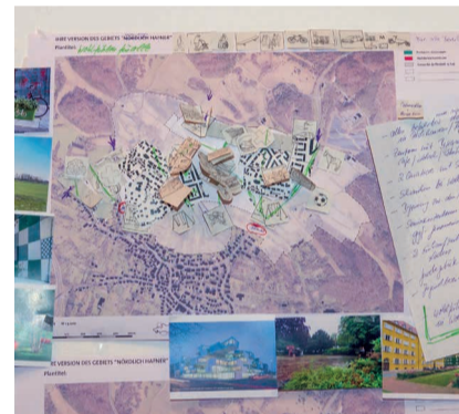
Einer aus 30 entstandenen Entwürfen

punkt. Mal wurde die Bebauung um die Freiräume herum geplant, um Nachbarschaften auf gemeinsamen Flächen zu fördern, mal standen Synergien aus Gewerbe und Wohnen im Fokus. Die am Wettbewerb teilnehmenden Planerteams gingen während der Arbeitsphase von Tisch zu Tisch und