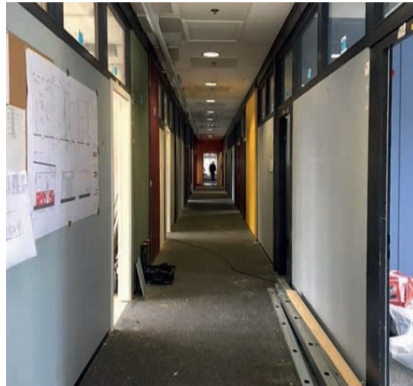
Umbauarbeiten in der Anschlussunterkunft

Derzeit laufen die Planungen für ein neues Wohnquartier auf dem Bückleareal. Wo früher einmal die Firma Siemens zuhause war soll Konstanzler Leben und Arbeiten unterkommen. Die Realisierung übernahm die Vorarlberger Unternehmensgruppe i+R, bei der die Planungen aktuell auf Hochtouren laufen. Und doch dauert es noch eine Weile, bis die Pläne vollständig umgesetzt werden können.