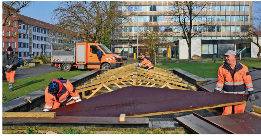
Das TBK-Team entfernt die aufwendige Brunnenabdeckung