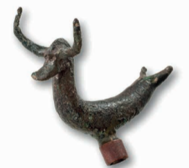
Tiergestalteter Aufstecker aus Bronze; Rosgartenmuseum Konstanz