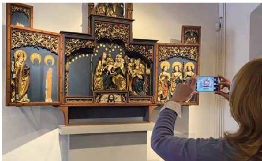
Videoclips und Beiträge aus den Konstanzer Museen bringen Kunst und Kultur in die eigenen vier Wände.

des Rosgartenmuseums und dem YouTube-Kanal präsentiert. Geplant sind neben Werkbetrachtungen aus der aktuellen Ausstellung der Städtischen Wessenberg-Galerie zum Impressionismus in Süddeutschland historische und zeitaktuelle Themen aus dem Rosgartenmuseum sowie ein interaktiver Kunstclub. Auch wenn die Türen für die Besucher derzeit geschlossen sind, so sind Museen dennoch für ihre Besucher da und bringen Kunst und Kultur in die eigenen vier Wände.