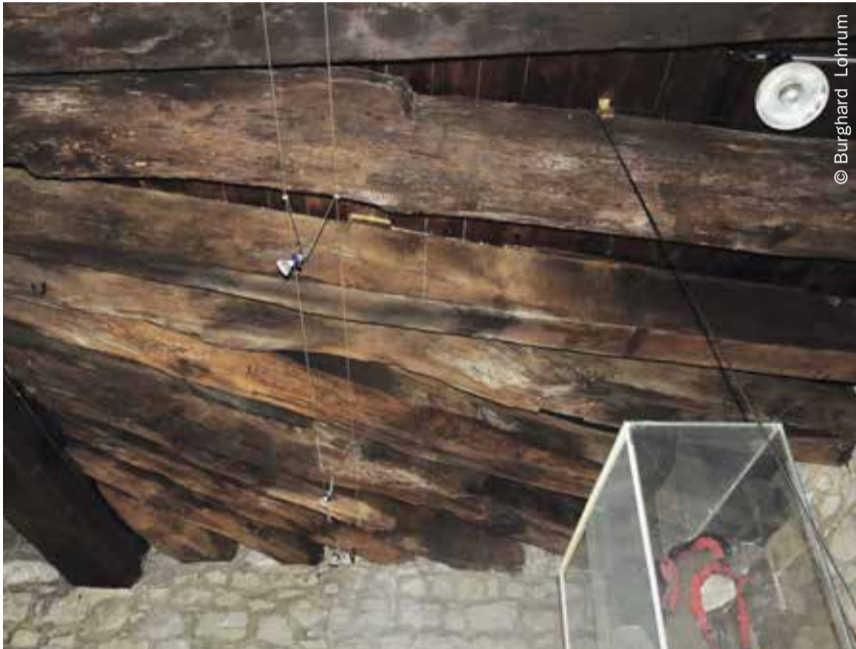
Etlche der Holzbalken im Schnetztor sind fast über 700 Jahre alt. Die hier abgebildeten Balken stammen aus den Jahren 1327/28.

Die Kosten des Gutachtens liegen bei 3.800 Euro; die Blätzlebueben beteiligen sich mit 999 Euro.