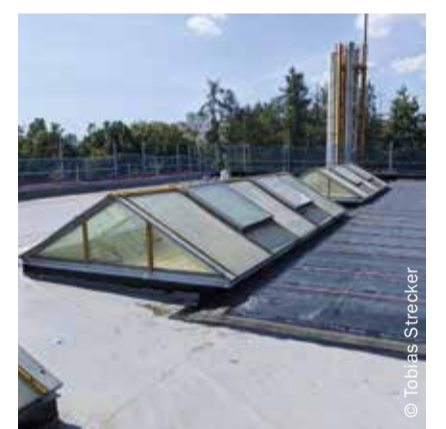
Insgesamt werden 2.700 Quadratmeter Dachfläche abgedichtet und neu begrünt.

handene Photovoltaik-Anlage wieder montiert. Für die weiteren Dächer ist ebenfalls eine Solarnutzung vorgesehen. Im Inneren werden aktuell zwei der sechs kreisrunden Toilettenanlagen grundsaniert. Es handelt sich um Schüler- und Lehrer-WCs im Erdgeschoss und im ersten Obergeschoss.