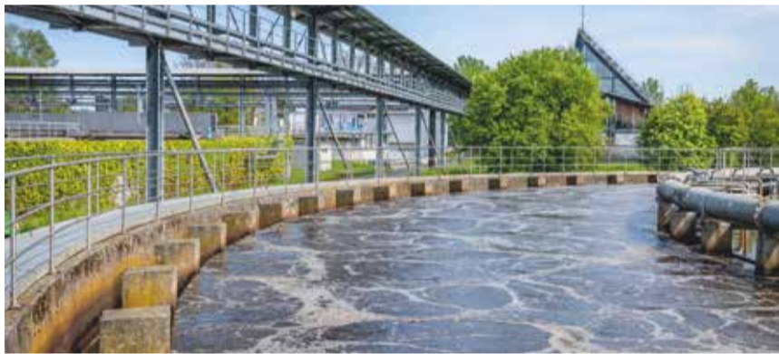
Die Konstanzer Kläranlage

Durch einen zuverlässigen Nachweis von SARS-CoV-2-Viren im Abwasser wäre ein mögliches Frühwarnsystem für lokale Corona-Ausbrüche geschaffen. Das Abwasser erfasst schließlich die gesamte Virenlast des Einzugsgebiets, nicht nur die Zahl der positiv getesteten Personen und damit dem Gesundheitsamt bekannten Infektionen. Das im Abwasser erkannte Infektionsgeschehen könnte sogar auf einzelne Ortsteile eingegrenzt werden, zumindest im Konstanzer Abwassersystem. Doch um diese großen Fragen zu beantworten, müssen auch die EBK und damit die Konstanzer auf die Auswertung der letzten Studienphase warten.