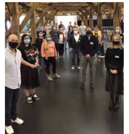
Der BürgerInnenrat besteht aus 20 zufällig ausgewählten BürgerInnen der Stadt Konstanz.

Möglichkeit, gute Ideen und Projekte umzusetzen. 100.000 Euro stehen jährlich dafür zur Verfügung. Gemäß den Richtlinien werden Projekte unterstützt, in denen die AntragstellerInnen Eigenleistung erbringen, die den Gemeininn fördern und die der Konstanzer Bevölkerung zugutekommen. Der Antrag muss bis zum 20. Juli des jeweiligen Jahres beim Beauftragten für Bürgerbeteiligung und Bürgerschaftliches Engagement eingegangen sein. Antragsberechtigt sind Vereine, Initiativen, aber auch Nachbarschaften. Die eingegangenen Anträge werden von der Verwaltung formell geprüft. Anschließend werden sie dem BürgerInnenrat vorgelegt, der dann entscheidet, welche Anträge gefördert werden sollen. Im Rahmen einer Vorlage entscheidet der Gemeinderat endgültig.