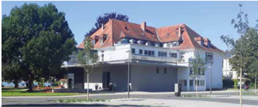
Das Konstanzer Casino heute

1949/1950 wurde das Casino Konstanz gegründet und nahm den Spielbetrieb im Juni 1951 auf. Seit dieser