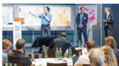
Abschlussworkshop zum Handlungsprogramm Wirtschaft

In den nächsten zwei Monaten werden die Ergebnisse aus der Standortanalyse, dem Beteiligungsprozess und dem Abschluss-Workshop ausgewertet. Am 23. Oktober wird dem Wirtschaftsausschuss das Strategiekonzept vorgelegt. Die Beschlussfassung durch den Rat ist am 22. November vorgesehen. Danach geht es an die Umsetzung.