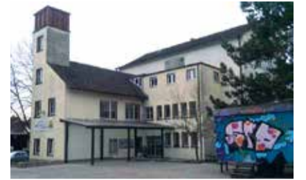
Das Alte Schulhaus in Dettingen soll zu einem Bürgerhaus umgestaltet werden.

Möglich werden die Maßnahmen durch die Aufnahme in ein Städtebauförderprogramm. Im ersten Schritt stehen eine Million Euro Zuschüsse zur Verfügung.