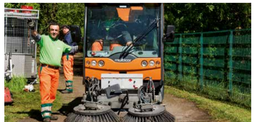
Das ganze Jahr für ein sauberes Konstanz unterwegs die Reinigungsteams der TBK

Die Teams der TBK stellen fest, dass die Verschmutzung im öffentlich genutzten Raum in den letzten Jahren zugenommen hat. Grund sind viel mehr Take away- und To go-Produkte, die verwendet und oftmals achtlos weggeworfen werden. Sie landen oft in Büschen oder auf der Straße. Kritisch sind auch die Glasflaschen, die auf Straßen und in Wiesen geworfen werden und dort zerbrechen. An den Scherben können sich Kinder, Erwachsene und Tiere verletzen. Das sogenannte Littering, das achtlose Wegwerfen von zumeist Verpackungsmüll und Flaschen, wird vorwiegend auf den Flanier- und Freizeitflächen entlang der Seelinien, der Radwege, Haltestellen sowie dem Schulumfeld sichtbar. Wünschenswert wäre es, wenn recycelfähiger Müll entsprechend entsorgt wird. Er ist wertvolles Ausgangsmaterial, das zu neuen Materialien verarbeitet werden kann. Jede Müllentsorgung oder gar -vermeidung trägt zu einem sauberen Konstanz bei und entlastet außerdem die Teams der TBK.