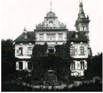
Eine historische Aufnahme des Gebäudes

Barrierefreiheit und Umgestaltung des Parkplatzes