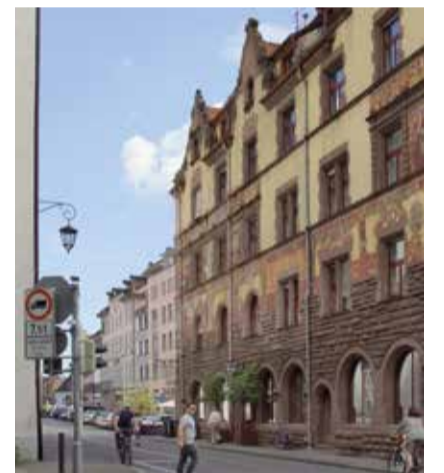
Zufahrt von der Laube zum Stephansplatz

weiterhin im Dialog mit Anliegern am Stephansplatz und beobachtet die Anliefersituation vor Ort.