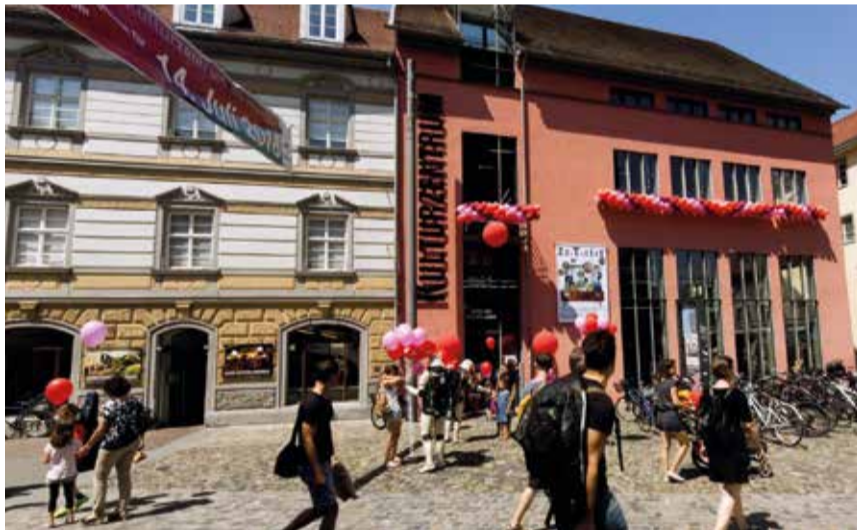
Bunte Luftballons für die Besucher

Ein Rückblick auf die Jubiläumsfeier am 14. Juli