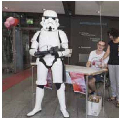
Star Wars Krieger der 501st German Garrison

Die Ausstellung im Gewölbekeller „Uff den Platten“, die sich mit der Geschichte des Kulturzentrum am Münster befasst, kann übrigens noch bis zum 9. September besucht werden.