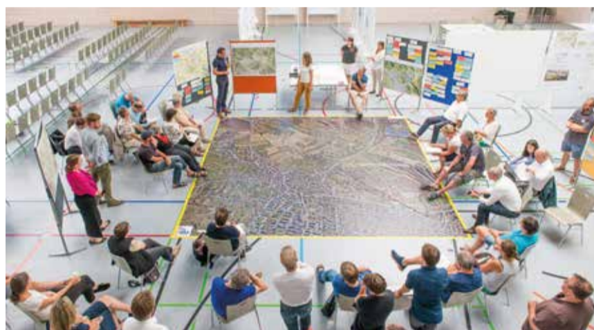
Zusammenfassung der Ergebnisse des 2. Bürgerforums in einer gemeinsamen Schlussrunde

OB Burchardt erinnerte in seiner Begrüßungsrede daran, dass Konstanz schon immer eine wachsende Stadt war. „Verglichen mit früheren Jahren wächst die Stadt aktuell moderat. Dieses moderate Wachstum birgt Chancen zur Weiterentwicklung und zum Austreten von neuen Wegen, wie zum Beispiel bei unserem Projekt „Zukunftsstadt“, von dem auch der Hafner profitiert“, so der Oberbürgermeister. In Bezug auf den Hafner machte er zudem deutlich, dass die Bedürfnisse von Eigentümern, Nachbarn und neuen Bewohnern mit der einzigartigen Topographie und Landschaft in Einklang stehen sollen. „Ich bin überzeugt, dass der Hafner Wollmatingen stärken wird und sich als innovatives