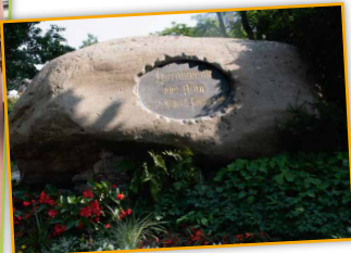
Natur- und Kulturdenkmal gleichzeitig: der Hussenstein