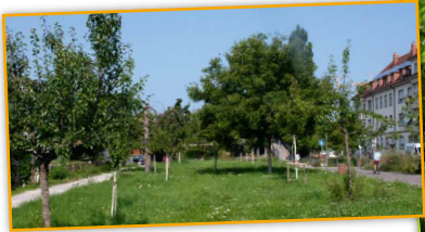
Streuobst mitten in der Stadt – paradiesisch!