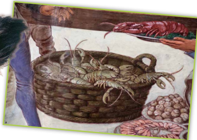
Ein mittelalterlicher Fischmarkt, festgehalten auf einer Hausfassade!