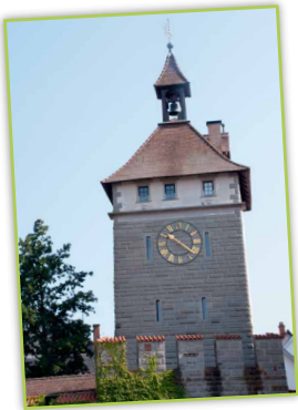
Die Stadtmauer am Schnetztor – ein Mosaik aus Gesteinen