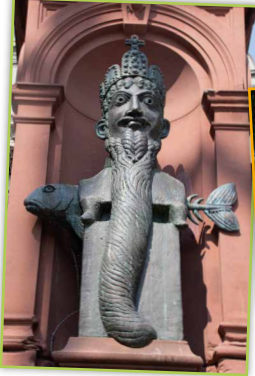
Der Kaiserbrunnen erzählt Geschichte(n) mit Augenzwinkern!