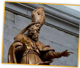
Die Spinne und der Heilige, zu entdecken im Konstanzer Münster!