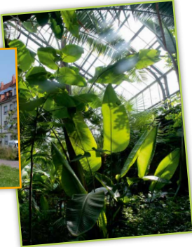
Ein Ort der Entschleunigung: das Palmenhaus