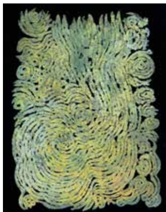
Schichtungen III; 1996 Papiercollage, eingefärbt; 34 x 24,5 cm Privatbesitz