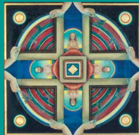
Ohne Titel ohne Jahr Mischtechnik auf Holz 70,0 x 68 cm Privatbesitz