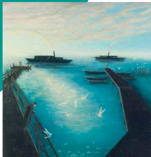
Ohne Titel; 1981 Mischtechnik auf Holz 80 x 74 cm Privatbesitz