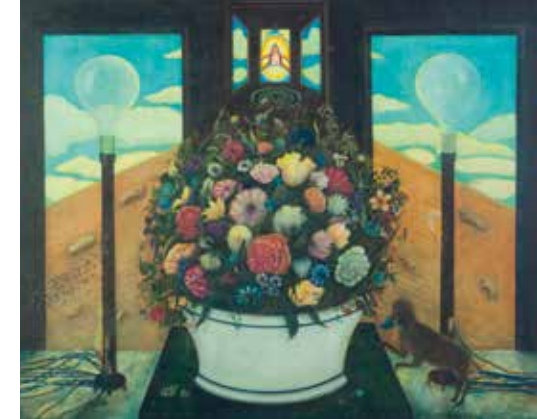
Ohne Titel; 1978 Mischtechnik auf Holz; 64,5 x 77,5 cm Privatbesitz