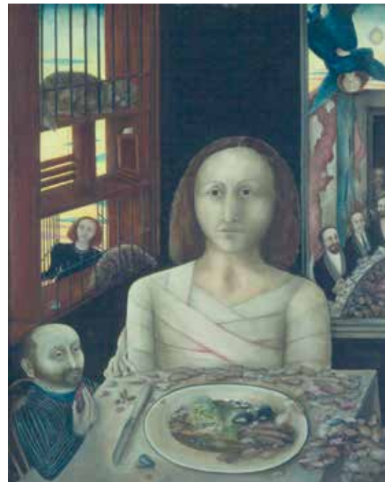
Eingebunden; 1978 Mischtechnik auf Hartfaserplatte 47 x 38 cm Privatbesitz

Simon-Bachs bis Mitte der 1980er-Jahre entstandenen Bilder loten die Grenzen zwischen dem Realen und dem Phantastischen aus, sie rücken das Alltagsleben ebenso in den Blick wie die Geheimnisse und Rätsel jenseits der sichtbaren Welt. Interieurs und Landschaften erscheinen symbolisch aufgeladen, immer wieder spielen Tiere, Blumen sowie Maschinen vieldeutige Rollen. Im Mittelpunkt ihres Schaffens steht das Selbstbildnis, in dem sie ihre Rollen als Frau und Künstlerin reflektiert. Leben und Tod, die Visualisierung von Beklemmung und Verletzung und die sich daraus erhoffte Befreiung und Heilung ziehen sich als Leitmotive durch ihre berührenden Bilder. Um 1986 wandte sich Simon-Bach der Abstraktion zu; es entstanden farblich zurückhaltende und in ihrer Textur fragile Arbeiten auf Leinwand und Papier sowie Objekte.