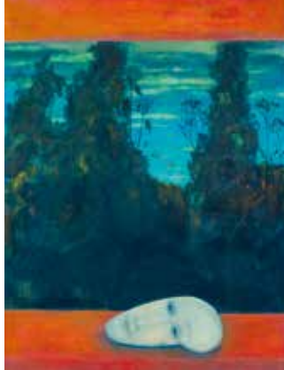
Ohne Titel; ohne Jahr Mischtechnik auf Holz 84,4 x 63,5 cm Privatbesitz