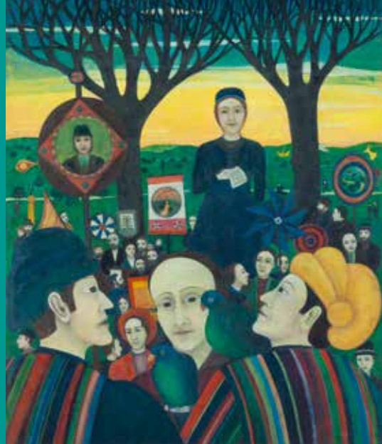
Ohne Titel; ohne Jahr Mischtechnik auf Holz 55 x 43 cm Privatbesitz