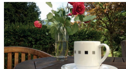
Das gemütliche Café im Seze.

Die Öffnungszeiten sind jeweils montags bis freitags von 9 bis 12 Uhr, und montags bis donnerstags von 14 bis 17 Uhr. Weitere Informationen im Seniorenzentrum für Bildung & Kultur, Obere Laube 38, oder unter Tel: 07531-9189834.