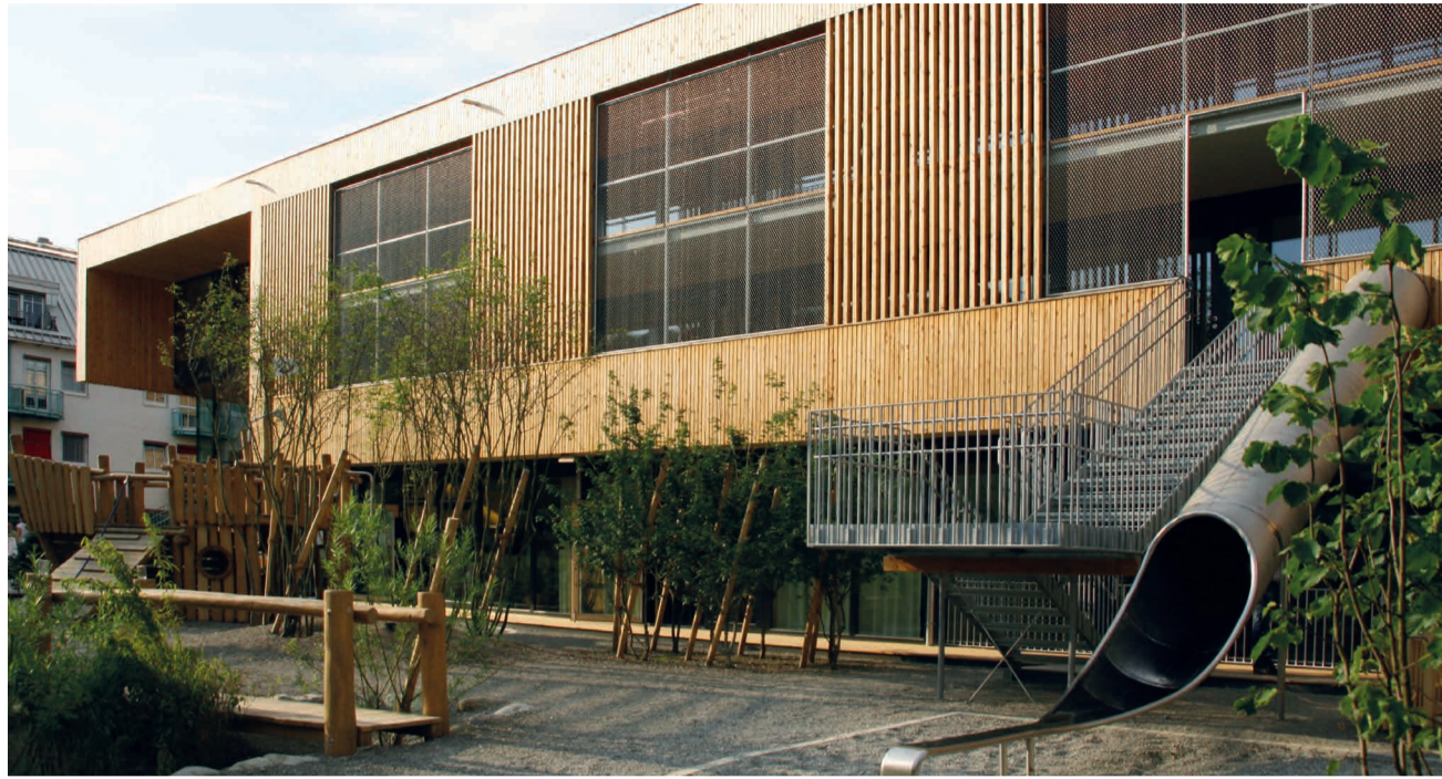
Auch das Kinderhaus Edith Stein in der Gustav-Schwabstraße erhält zusätzliche Plätze.

Auch die Mitteilung, dass das Kind bisher keinen Platz in der ersten Vergaberunde bekommen hat, wurde zeitgleich ab 7. Mai an die Eltern verschickt. Insgesamt konnte bisher an rund 30 Kindergartenkinder (Ü3) kein Platz vergeben werden. Diese Kinder sind allerdings entweder noch nicht tatsächlich nach Konstanz gezogen oder deren Eltern wollten sie nicht außerhalb ih-