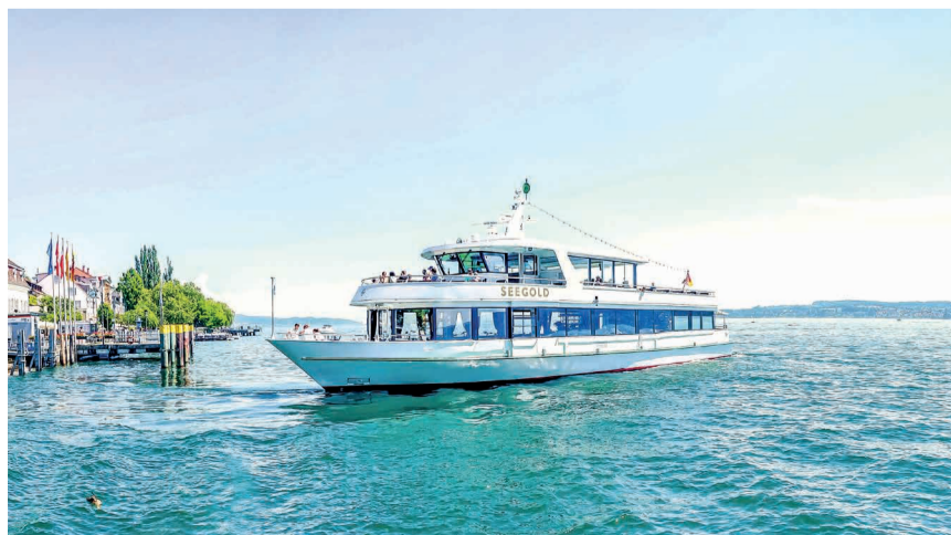
Zwischen Wallhausen und Überlingen pendelt die Seegold.

Die Personenfährrverbindung Wallhausen - Überlingen wird durch die Fa. Personenschiffahrt Giess & Giess GmbH betrieben. In den Sommermonaten besteht eine starke touristische Nachfrage, sodass der Betrieb kostendeckend ist. In den Wintermonaten wird diese Fährverbindung hauptsächlich von Bürgerinnen und Bürgern der Städte Konstanz und Überlingen nachgefragt. Es besteht in dieser Zeit ein auf diesen Bedarf abgestimmter und gegenüber den Sommermonaten reduzierter Fahrplan, der allerdings nicht kostendeckend betrieben werden kann.