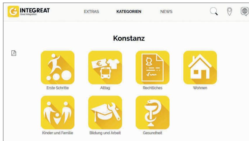
Die App kann auch ohne mobiles Gerät über jeden Internet-Browser als Desktop-Version genutzt werden.