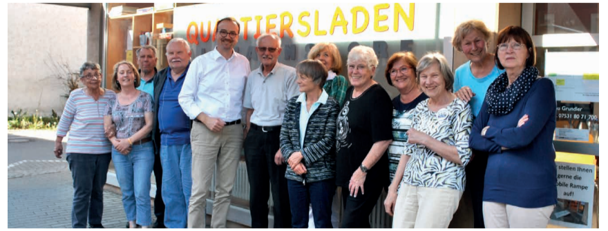
Gastgeber des Treffens war die Lebendige Nachbarschaft (LENA).