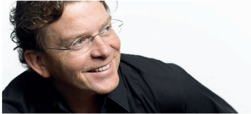
Dirigent Marcus Bosch präsentiert gemeinsam mit der Südwestdeutschen Philharmonie Bruckners Musik.

Karten für das Konzert im Münster sind beim Stadttheater Konstanz (07531 900-150), bei der Südwestdeutschen Philharmonie (9.00 Uhr bis 12.30 Uhr) und bei der Tourist-Information am Hauptbahnhof, sowie allen Ortsteilerverwaltungen erhältlich. Tickets können auch bequem im Internet gekauft und per print@home ausgedruckt werden unter: www.philharmonie-konstanz.de .