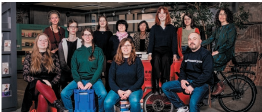
Das Team der Stadtbibliothek heißt Sie herzlich willkommen!