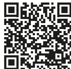
Парковки міста та вільні місця