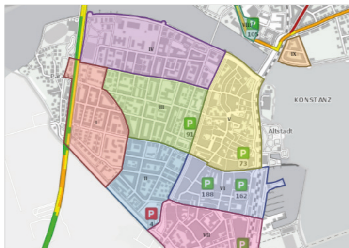
Парковочні зони для мешканців району Paradies та підземні парковки.

До вас ідуть гості? Запропонуйте їм приїхати потягом. У будь-яку точку міста можна доїхати автобусом, орендованим велосипедом або дійти пішки. Як що без автівки не обійтися, то парковка на P&R Bodensee коштує 3€ на день (пн.-сб.), для п'яти осіб діє Kombiticket за 5-6€. Парковочний талон діє на поїздки на автобусі від парковки і назад.