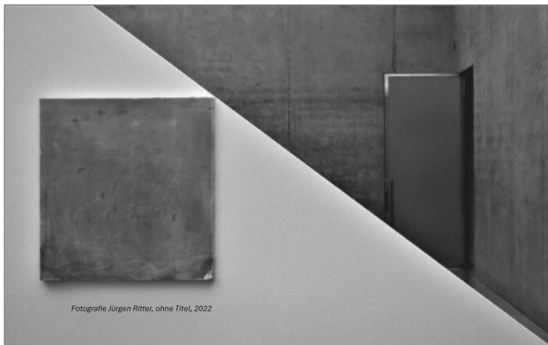
Fotografie Jürgen Ritter, ohne Titel, 2022