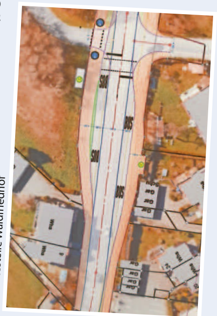
Konzept Sanierung MSS bei Bushaltestelle Waldfriedhof