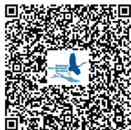
Natur & Kultur