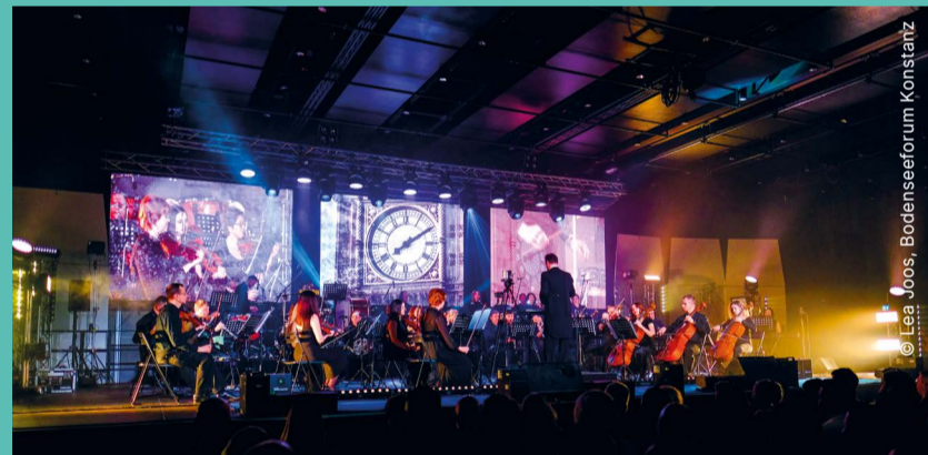
„The Music of Hans Zimmer & others“ begeisterte knapp 700 Menschen im Bodenseeforum Konstanz.

nur eine musikalische Darbietung, sondern auch beeindruckende Lichtinstallationen, Laserprojektionen und zeigt die passenden Filmausschnitte zur Musik. Aufgrund der hohen technischen Anforderungen war das Bodenseeforum der exklusive Veranstaltungsort. Mit einer ausverkauften Veranstaltung, die fast 700 Menschen anzog, begeisterte es das Publikum. Die Veranstaltenden waren derart beeindruckt von Location und Publikum, dass sie am 7. April zurückkehren – diesmal sogar mit einem Doppelkonzert.