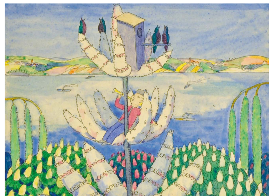
Konrad Ferdinand Edmund von Freyhold, der kleine Musikant, 1905, Kunst Museum Winterthur

Der Eintritt ist kostenfrei. Veranstaltungsort und Infos: Seniorenzentrum Bildung + Kultur, Obere Laube 38, 78462 Konstanz, 07531 284 / 23 57.