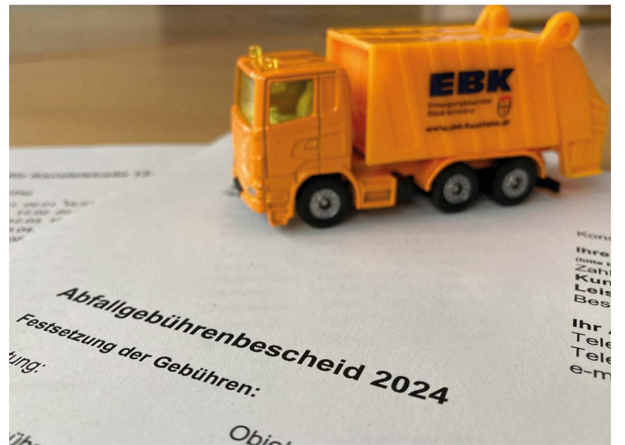
Der Abfallgebührenbescheid kommt mit allen Abfuhrterminen bis einschließlich Januar 2025.