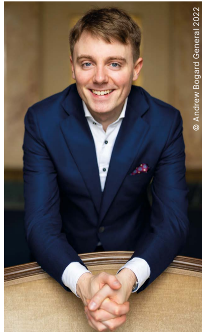
Dirigent Killian Farrell

Karten sind beim Stadttheater Konstanz (07531 900 2150), bei der Südwestdeutschen Philharmonie (9 bis 12.30 Uhr) und bei der Tourist-Information am Hauptbahnhof sowie allen Ortsteilverwaltungen erhältlich. Tickets können auch bequem im Internet gekauft und per print@home ausgedruckt werden unter www.philharmonie-konstanz.de.