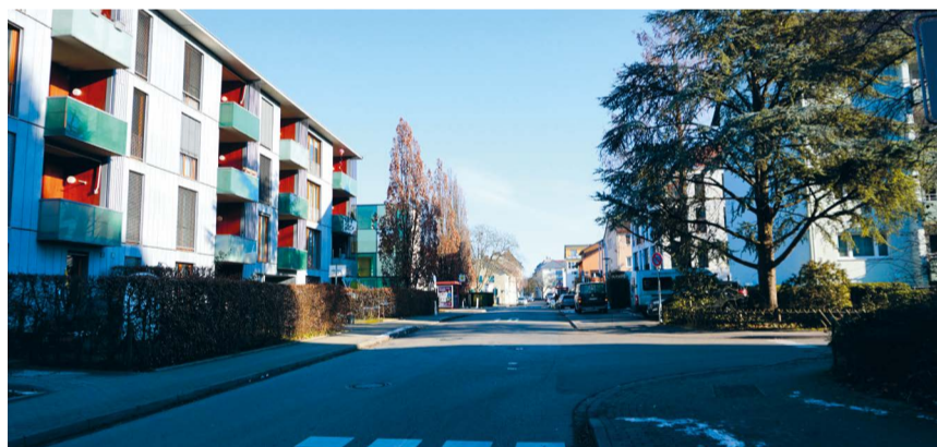
Vier neue Fußgängerüberwege werden an Schulwegen und einem Seniorenzentrum in diesem Jahr eingerichtet, unter anderem hier an der Gartenstraße Höhe Feldstraße (Bild unten) und an der Eichhorn-/Hebelstraße (Bild oben). Die weiteren entstehen an der Riedstraße Höhe Karlsruher Straße und am Höhenweg/Uhlandstraße.

cher unterwegs sein. So können sie früher bzw. länger am sozialen Leben teilhaben“, erklärt die Verkehrsplanerin und Projektleiterin des HaPro Fuß, Polina Vorobyeva vom Amt für Stadtplanung und Umwelt (ASU). Das HaPro Fuß steckt die strategischen Ziele der Fußwegenetzoptimierung ab. Es ist ein Maßnahmenkatalog für Orte, an denen Handlungsbedarf zur Verbesserung des Fußverkehrs besteht. Die Behebung baulicher Mängel wie schlechte Belagsqualität oder fehlende Gehwegabsenkungen sind dagegen nicht Teil des Handlungsprogramms. Diese Themen werden im Rahmen von Straßenbauarbeiten berücksichtigt.