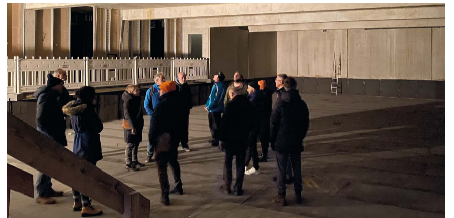
Die VertreterInnen der Sportvereine stehen hier in der zukünftigen neuen Gymnastikhalle in der Erweiterung der Schänzlehalle.

Der Neubau erhält noch ein Solargründach sowie eine fassadenintegrierte PV-Anlage an der Südseite, wodurch der neue Gebäudeteil weitestgehend durch regenerative Energien betrieben werden kann. Als nächster Schritt folgt nun die Ausschreibung der Innenausstattung, sodass die Fertigstellung voraussichtlich wie geplant im Oktober erfolgen kann.