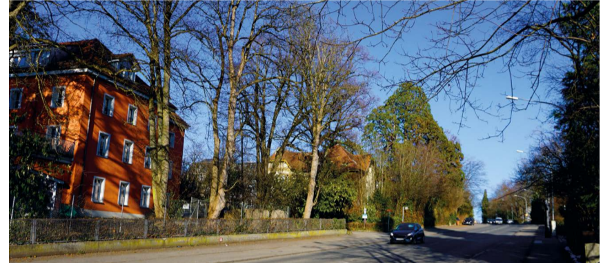
Das Kinderhaus Salzberg liegt an der viel befahrenen Mainastraße. Um die Querung sicherer zu machen, ist eine Mittelinsel auf Höhe der Zeppelinstraße im Arbeitsprogramm 2024 vorgesehen.