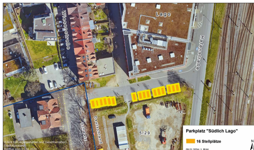
Die 16 provisorischen Stellplätze südlich vom LAGO Shopping Center

Voraussetzung für die Bewerbung um einen Parkplatz ist ein Hauptwohnsitz in Stadelhofen (Kreuzlinger Str., Emmishofer Str., Schwedenschanze, Zur Laube, Bodanstr., Falkengasse, Scheffelstr., Zogelmannstr., Stadelhofgasse, Hüetlinstr., Bodanplatz, Wiesenstr., Ackertorweg, Otto-Raggenbass-Str.). Pro Haushalt kann ein Pkw-Stellplatz (keine Wohnmobile) gemietet werden, der für ein zugelassenes Kfz-Kennzeichen vergeben wird. Die Beschilderung des Parkplatzes mit diesem Kfz-Kennzeichen ist möglich. Die monatlichen Kosten für die Stellplatzmiete belaufen sich auf 85 € inkl. MwSt., dies wird vertraglich festgehalten. Wenn mehr Bewerbungen eingehen als Parkplätze zur Verfügung stehen, entscheidet das Eingangsdatum. Einsendung der Bewerbung mit Nachweis des Hauptwohnsitzes in Stadelhofen, Ausweiskopie und Kopie des Fahrzeugscheins mit Autokennzeichen bitte an: liegenschaften@konstanz.de . Weitere Information unter: www.konstanz.de/stadelhofen