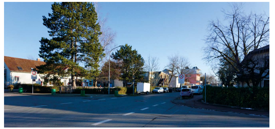
An der Fritz-Arnold-Straße/Robert-Bosch-Straße ist ein Fußgängerüberweg im Arbeitsprogramm 2024 vorgesehen. Er ermöglicht in Zukunft für die SchülerInnen der Freien Waldorfschule eine sicherere Querung.

Diese Bürgerbeteiligung ermöglichte es, eine Priorisierung der Handlungsbedarfe nach Dringlichkeit zu erstellen. Fielen alle drei Kriterien positiv aus, wurde einem Handlungsbedarf die höchste Dringlichkeitsstufe – die Stufe 1 – zugewiesen. Waren alle drei Kriterien negativ, wurde einem Handlungsbedarf die niedrigste Dringlichkeitsstufe – die Stufe 3 – zugewiesen. In einigen Fällen wurde auch die von der Projektgruppe vorgeschlagene Dringlichkeitsstufe durch das Ergebnis der Bürgerbeteiligung ersetzt. Darauf aufbauend und gemeinsam mit dem Arbeitskreis Rad- und Fußverkehr sowie den Ortschaftsräten Det-