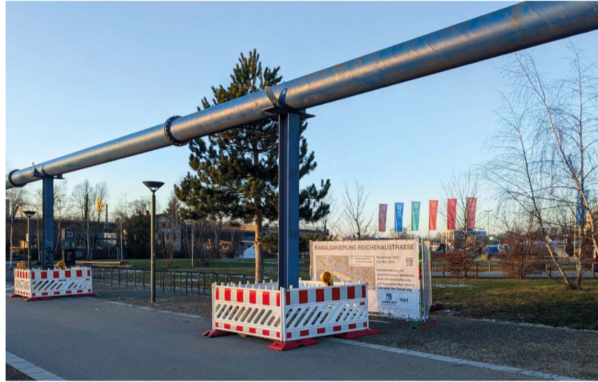
Die Abwasserleitung entlang des Seerheins ist mittlerweile in Betrieb.

Aktuelle Informationen und einen Rückblick über die bereits erfolgten Arbeiten sind auf der Website der EBK in der Rubrik ‚Baumaßnahmen‘ zu finden.