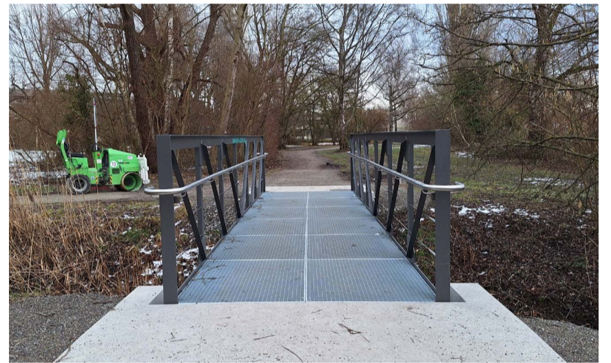
Neue Brücke am Uferweg in Stromeyersdorf fertiggestellt: Eines der vielen lauschigen Plätzchen am Konstanzer Seerhein ist der Uferweg im Gewerbegebiet Stromeyersdorf. Nachdem dort eine marode Holzbrücke als verbindendes Element zwischen dem Gelände des Kleingartenvereins und der Bleiche aus Sicherheitsgründen abgerissen werden musste, hat die Stadt Konstanz einen Fußgängersteg mit stählernem Fachwerk installiert. Der Steg ist acht Meter lang und 1,80 Meter breit.

Informationen zum Programm und Anmeldung gibt es unter www.vhs-landkreis-konstanz.de .