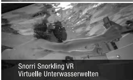
Snorri Snorkling VR Virtuelle Unterwasserwelten