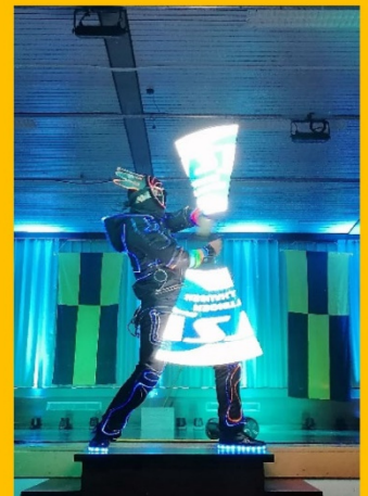
Geräteturnen für Mädchen