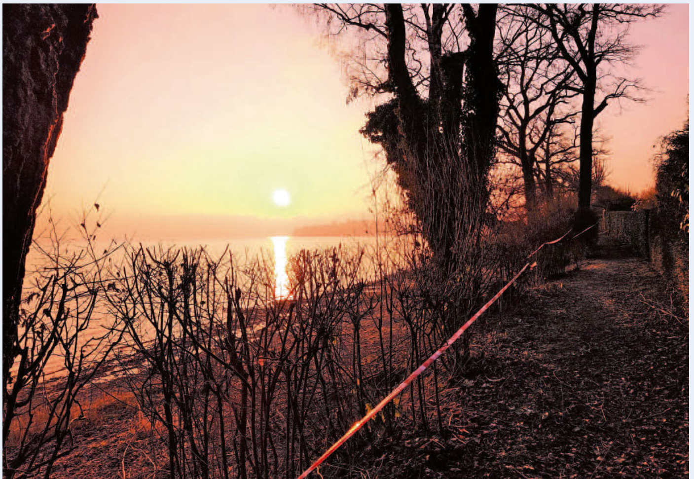
Sonnenaufgänge können nun ungehindert vom Seeuferweg aus genossen werden.

Gemäß dem Entwicklungskonzept für die Ufergrundstücke zwischen Holdersteig und Strandbad sind nun erfreuliche Fortschritte zu sehen. Mitarbeiter des Litzelstetter Bauhofs haben Büsche und Hecken in Absprache mit dem Amt für Stadtplanung und Umwelt und dem beteiligten Planungsbüro fachmännisch zurückgeschnitten. Der öffentliche Weg, der bislang eher einem undurchsichtigen Tunnel glich, bietet nun vielfältige Sichtbeziehungen zum See. Betonfundamente und Treppen der ehemaligen Pächter entlang des Ufers wurden abgerissen. Die Errichtung eines Aussichtspunkts und weitere Bänke folgen.