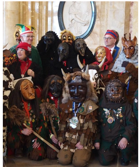
Artikel und Bild: Jutta Cappel

Fur die Moorschat in Stuttgart: Prasident Frederic Huff, „Schreiberling“ Kai Gorig sowie Sophie Mayer von den Dill-dappenfanger.