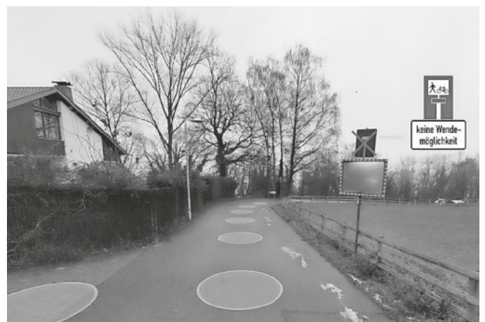
Kommende Beschilderung Großherzog-Friedrich-Straße auf Höhe Am See

Um das erhöhte Verkehrsaufkommen am neu belebten Litzelstetter Campingplatz zu kanalisieren, hat die Ortsverwaltung in Zusammenarbeit mit der Verkehrsbehörde und dem Tiefbauamt eine neue Beschilderung erarbeitet. Schon bei der Zufahrt auf der Großherzog-Friedrich-Straße - in Höhe der Straße „Am See“ - wird künftig darauf hingewiesen, dass der Weg für Motorfahrzeuge nach dem Campingplatz endet und keine Wendemöglichkeit besteht. Dies soll potenzielle Unfallgefahren auf dem stark frequentierten Bodenseeradweg minimieren.