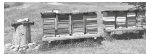
Stehende Klotzbeute (Steinzeit) neben modernen Bienenkästen

Herzlich Willkommen Ihr Kinder und Erzieher vom Kindergarten Maria Hilf in Konstanz. Heute zeige ich Euch wie die Bienen leben. Wie machen wir Imker das heute, damit wir Honig von den Bienen bekommen und was braucht es alles, damit es den Bienen gut geht. Wie erkennt man, was das Bienenvolk gerade braucht, ob es eine neue Königin ausbrütet und sich das Volk bereit macht zum Teilen - also dass die neue Königin mit der Hälfte des Schwarms ausfliegt und eine neue Behausung sucht und wie kann ich das als Imker verhindern?