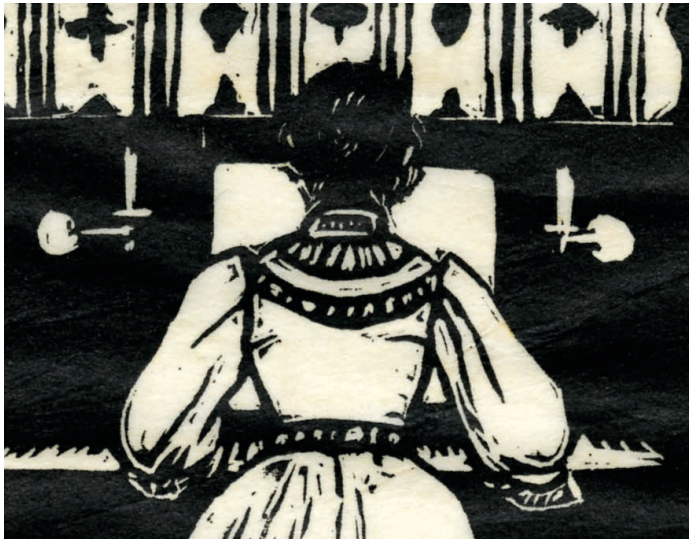
Am Klavier; 1905 Holzschnitt; 34,5 x 27 cm Städtische Wessenberg-Galerie Konstanz