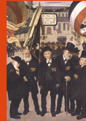
Die Veteranen; 1926 Öl auf Leinwand; 201 x 141,5 cm Privatbesitz