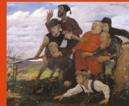
Die sieben Schwaben; 1897 Öl auf Holz 73,5 x 89 cm Zeppelin Museum Friedrichshafen - Technik und Kunst

Es erscheint ein Katalog im Nimbus-Verlag (24,80 Euro an der Museumskasse).