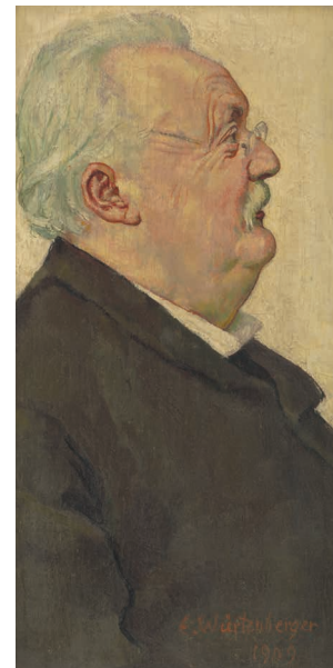
Bildnis Conrad Ferdinand Meyer; 1909 Öl auf Leinwand; 29,5 x 14 cm Conrad Ferdinand Meyer-Haus Kilchberg