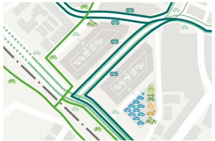
Das zukünftige Mobilitätskonzept am Döbele

Der Technische und Umweltausschuss wird über die Planung entscheiden. Die öffentliche Auslegung soll Mitte August bis Ende September erfolgen. Während der Offenlage können Stellungnahmen abgegeben werden. Alle Unterlagen werden online einsehbar sein.