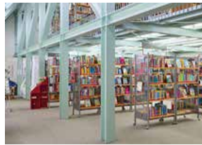
Blick in die Stadtbibliothek

Einlass nur mit gültigem Bibliotheksausweis oder zur Neuankündigung, Händedesinfektion am Eingang, Tragen eines Mund-Nasenschutzes, Mindestabstand von 1,5 m zu anderen Personen, kein längerer Aufenthalt in der Bibliothek.