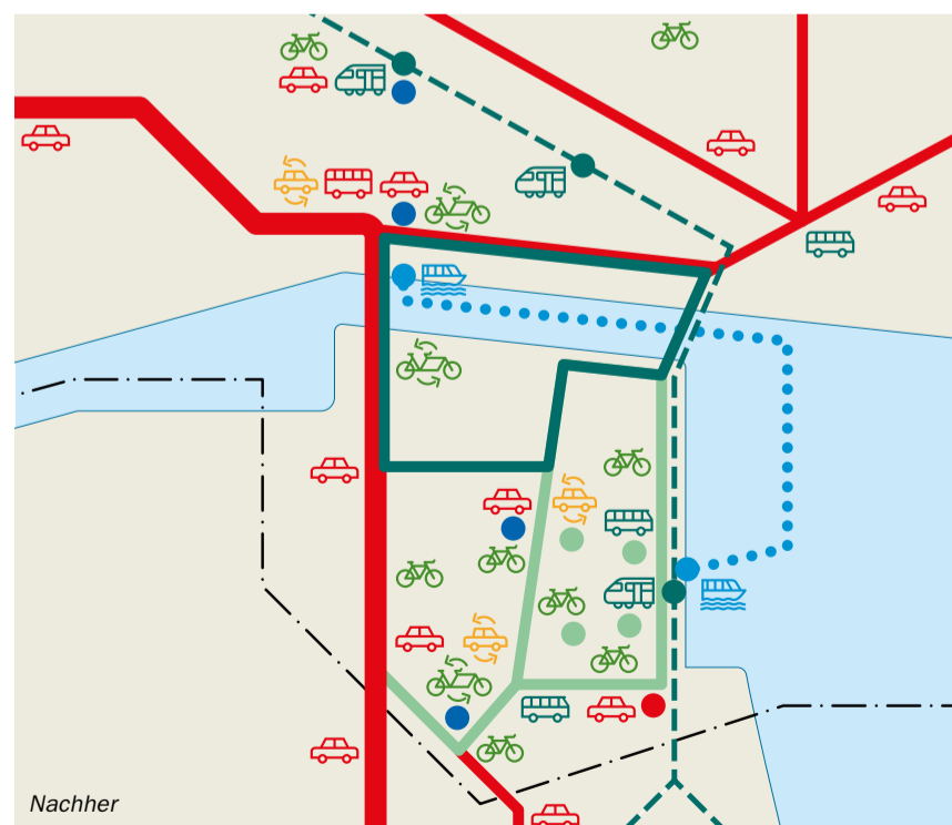
Verkehrssystem autofreie Innenstadt: Die Bedingungen für den Fuß- und Radverkehr werden verbessert und der öffentliche Verkehr ausgebaut. An Mobilitätspunkten werden die Verkehrsarten verknüpft und Mietsysteme angeboten. Eine kostenlose Bus-Ringlinie (—) und der Wasserbus (•••••) bringen Besucher vom zentralen P+R Brückenquartier in die Innenstadt.