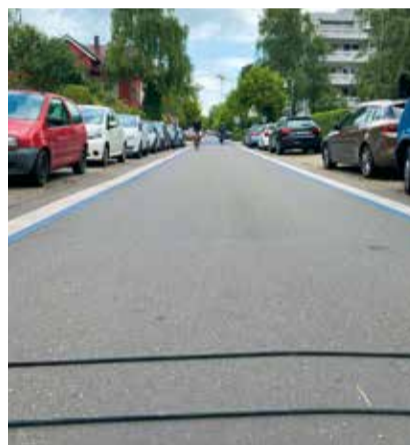
Radverkehrsmengen: Für einen besseren Überblick über die Anzahl der Radfahrer und Fußgänger an einzelnen Stellen, hat die Stadt Konstanz zwei neue, mobile Zählgeräte beschafft. Erstmals zum Einsatz kamen sie in den vergangenen Wochen in der Schottenstraße und im Herosé-Park. Perspektivisch sollen die Daten im städtischen OpenData Portal www.offenedaten-konstanz.de einlaufen.

Das Zufußgehen wird unterschätzt, hat aber eine hohe Bedeutung für eine klimaneutrale Mobilitätsentwicklung. Die „Stadt der kurzen Fußwege“ passt zu Konstanz und schließt neben nachhaltiger Fortbewegung auch die