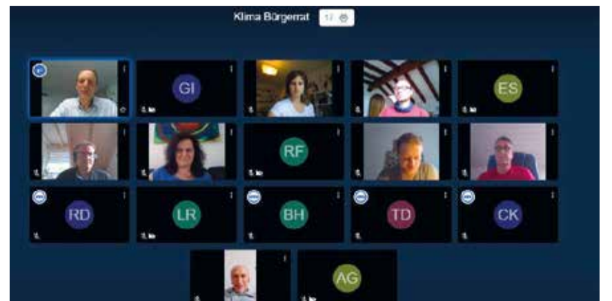
Am 17. Juni trafen die Mitglieder des Klima-Bürgerrats erneut zusammen – dieses Mal virtuell.

Mehr Informationen unter: www.konstanz.de/klima-budget