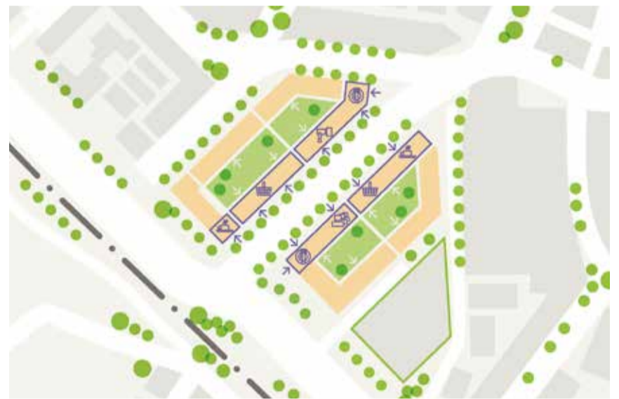
Im Erdgeschoss der Gebäude am neuen Döbele-Boulevard entstehen vielfältige Angebote.