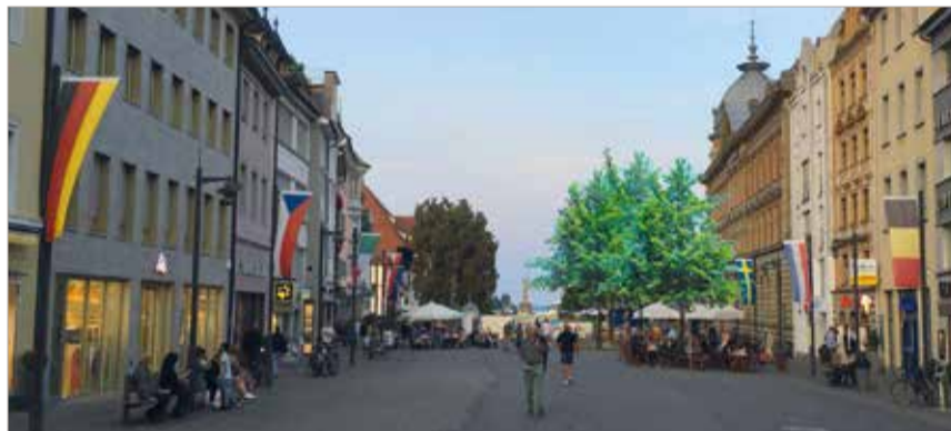
Die Bildmontage zeigt, wie die neue Baumgruppe auf der Marktstätte aussehen könnte.

Stadtplanerisches Ziel ist es, das Angebot an öffentlichen, qualitativ hochwertigen und beschatteten Sitzplätzen im gesamten Stadtgebiet weiterhin zu entwickeln und auszubauen. So leisten die Bäume nicht nur einen Beitrag zum Klimaschutz, sondern tragen auch wesentlich zu mehr Aufenthaltsqualität für alle bei.