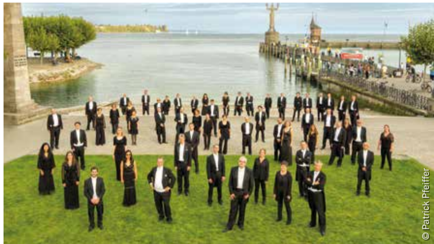
Das Ensemble der Philharmonie im Konstanzer Hafen (Archivbild)

präsent zu sein. Und so entstanden in einer Zeit des fast vollständigen kulturellen Stillstandes neue Kooperationen, wie unter anderem die Zusammenarbeit mit dem Europäischen KulturForum Mainau e.V. Die Einnahmen der Konzerte im Palmehaus kommen der Förderung junger Klassiktalente zugute. Die Konzerte finden unter Beachtung der geltenden Corona-Verordnung „Veranstaltung“ statt.