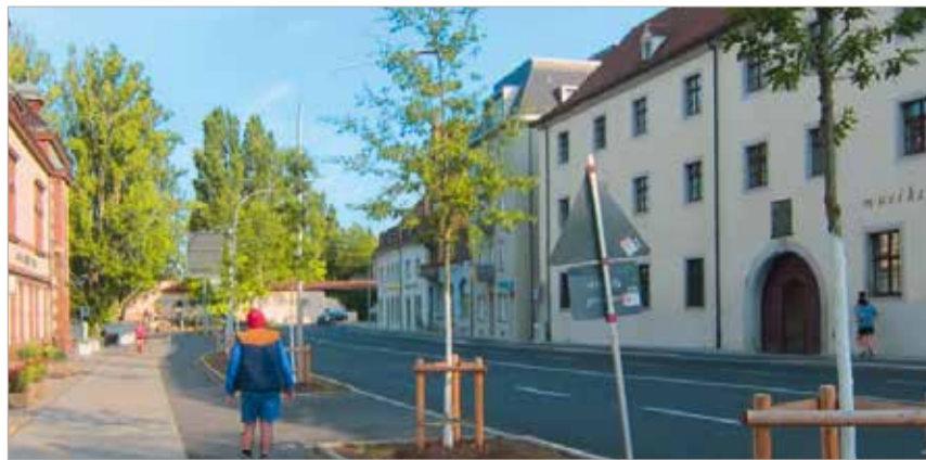
Nachdem die alten Bäume in der Spanierstraße gefällt werden mussten, wurden die Baumquartiere neu hergestellt und neun Eichen gepflanzt.

Die vor Baubeginn in der Spanierstraße stehenden Bäume verkümmerten infolge schlechter Standortverhältnisse und drohten, angesichts zunehmender Hitze- und Trockenperioden in wenigen Jahren abzusterben. Daher wurden sie, nachdem der Boden ausgetauscht war, durch tro-