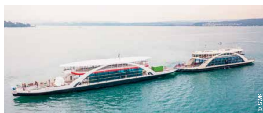
LNG-Fähre: Die neue mit Gas betriebene Fähre der Stadtwerke (links im Bild) ist im Rohbau fertig. Der weitere Ausbau findet auf dem Fähre-Gelände in Staad statt. Das Schiff wurde am 26. Juni von der Werft in Österreich an ihren künftigen Heimathafen Staad geschleppt.