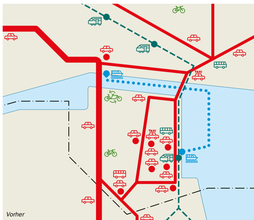
Verkehrssystem Innenstadt heute: Das Straßensystem der Innenstadt wurde für den motorisierten Individualverkehr dimensioniert. Künftig ist die Innenstadt zwar weiterhin mit dem Auto erreichbar, aber um die Aufenthaltsqualität zu verbessern, wird der Autoverkehr über ein digitales Verkehrs- und Parkraummanagement reduziert. Die Parkhäuser innerhalb des Altstadtrings dienen dann überwiegend den Bewohnern.

4. Verbesserung der Leistungsfähigkeit der Grenzübergänge: Ein Bündel an Maßnahmen trägt zum besseren Verkehrsfluss an den Grenzübergängen bei. Seit 2018 werden die Ausfuhrkassenzettel an der Zoll-Außenstelle am Brückenkopf Nord abgefertigt. Dadurch hat sich der Kfz-Andrang auf die Stellplätze der Grenzübergänge reduziert. Vor Weihnachten 2019 hat das Schweizer Bundesamt für Straßen auf Bitte der Stadt Konstanz die verkehrliche Leistungsfähigkeit der Gemeinschaftszollanlage verbessert, indem der dortige Besucherparkplatz von zwölf auf 36 Stellplätze erweitert wurde. So ist es an den Hochlasttagen in der Advents- und Weihnachtszeit 2019 zu keinen erheblichen Staus im Ausreiseverkehr in die Schweiz gekommen. Die Stempelung von Ausfuhr-Kassenbelegen am Emmishofer Zoll wurde eingestellt. Mithilfe einer App werden die Belege per Handy erfasst.